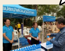
การสนับสนุนน้ำดื่ม

การสนับสนุนกิจกรรมชุมชน ถือเป็นการสร้างประโยชน์ต่อ “สังคม”