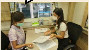
การให้สวัสดิการดูแล สุขภาพจิตพนักงาน

การดูแลพนักงาน (สิทธิมนุษยชน) เป็นการสร้างผลกระทบต่อเชิงบวก ภายใน “สังคม” ขององค์กร