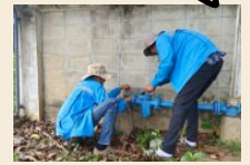
เสี่ยงดังรบกวาน จากการซ่อมท่อตัน

การทำงานที่เสี่ยงดังในเวลากลางคืน ถือเป็นการส่งผลกระทบต่อเชิงลบ ต่อ “สังคม”