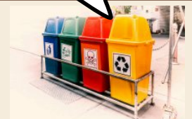
การรณรงค์แยกขยะ ในสำนักงาน

การสร้างวินัยในการจัดการขยะ ช่วยลดผลกระทบต่อ “สิ่งแวดล้อม”