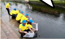
กิจกรรมปล่อยพันธุ์ปลา คืนสู่แหล่งน้ำ

การเพิ่มความหลากหลายทางชีวภาพ เป็นการส่งผลกระทบต่อเชิงบวก ต่อ “สิ่งแวดล้อม”