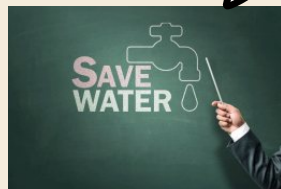
การเผยแพร่ความรู้ การใช้น้ำอย่างประหยัด

การสร้างความตระหนักรู้ให้ “สังคม” เพื่อการใช้ทรัพยากร “สิ่งแวดล้อม” อย่างยั่งยืน