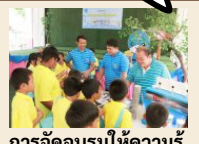
การจัดอบรมให้ความรู้ เรื่องน้ำแก่โรงเรียน

การสร้างความตระหนักรู้ให้ “สังคม” เพื่อการใช้ทรัพยากร “สิ่งแวดล้อม” อย่างยั่งยืน