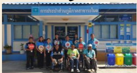
การจ้างงานผู้พิการ

กปภ. สร้างโอกาสและ ความเท่าเทียมใน “สังคม”