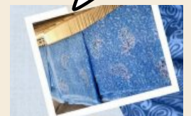
การจัดซื้อสินค้า/จ้างเหมา ในท้องถิ่น

การกระจายรายได้และ สนับสนุนเศรษฐกิจ “ชุมชน” (สังคม)